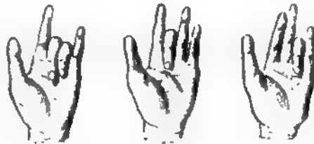
Четыре. Пять. Шесть.

загнутый безымянный палец обозначаетъ . . . 6.